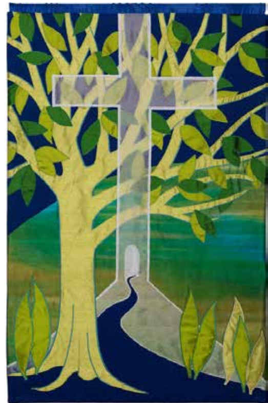
Liturgisch kleding Immanuelkerk Delft